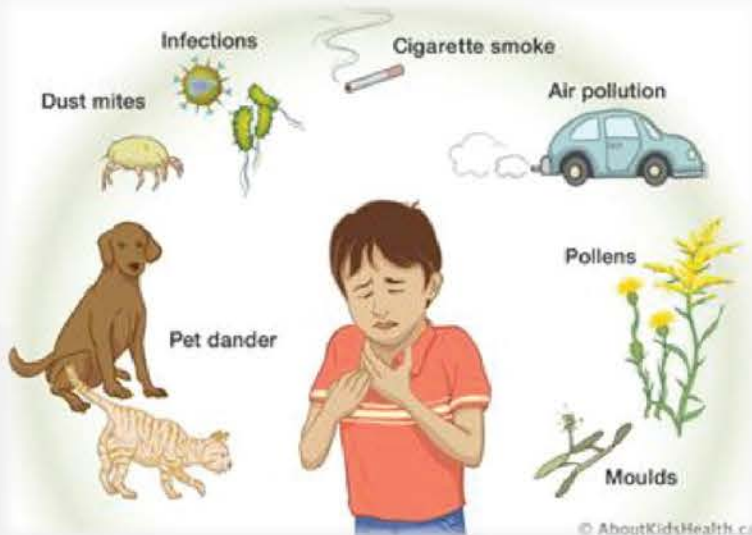
ภาพที่ 1 ตัวอย่างสิ่งกระตุ้นที่ส่งเสริมให้เกิดอาการหอบหืด เช่น ขนสัตว์ ไรฝุ่น การติดเชื้อ ควันบุหรี่ ควันรถ เกสรดอกไม้และเชื้อรา เป็นต้น

มีอาการไอตอนเช้า ตอนกลางวัน ตอนดึก ในผู้ป่วยบางรายเวลาหายใจมีเสียงหวีด หรือมีอาการแน่นหน้าอกร่วมอยู่ด้วย หรือหายใจลำบาก หรือผู้ป่วยบางรายอาจมาพบแพทย์ด้วยอาการไอเรื้อรังแต่เพียงอย่างเดียว