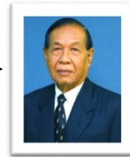
ผู้ทรงคุณวุฒิประจำคณะแพทยศาสตร์