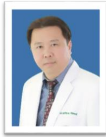
คณบดีคณะแพทยศาสตร์