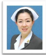
หัวหน้าสำนักเลขานุการคณะแพทยศาสตร์