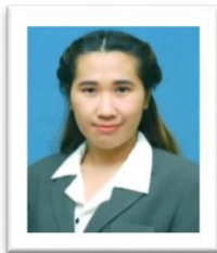
นิติกร(ปฏิบัติหน้าที่ในหัวหน้าหน่วยนิติการ)