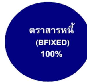
Sub Fund 2

กองทุนตราสารหนี้ (ไม่รวมตราสารหนี้เอกชน)