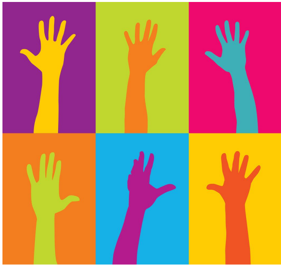
Sub Fund 1 (นโยบายเดิม)