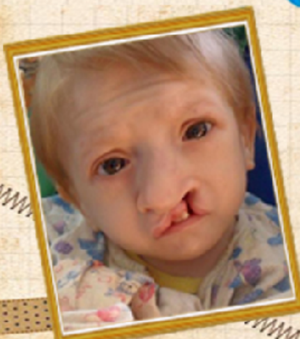
เด็กที่มีอาการ Edward's Syndrome

วินิจฉัยโดยการเจาะดูน้ำคร่ำ การตัดชิ้นเนื้อของรก ซึ่งโรคนี้ยังไม่มีการรักษาที่แน่นอน 50% ของเด็กที่เกิดมาเสียชีวิตภายใน 1 สัปดาห์แต่เด็กบางคนสามารถมีชีวิตได้จนถึงช่วงวัยรุ่น แต่ควรมีภาวะแทรกซ้อนและมีปัญหาเกี่ยวกับพัฒนาการ