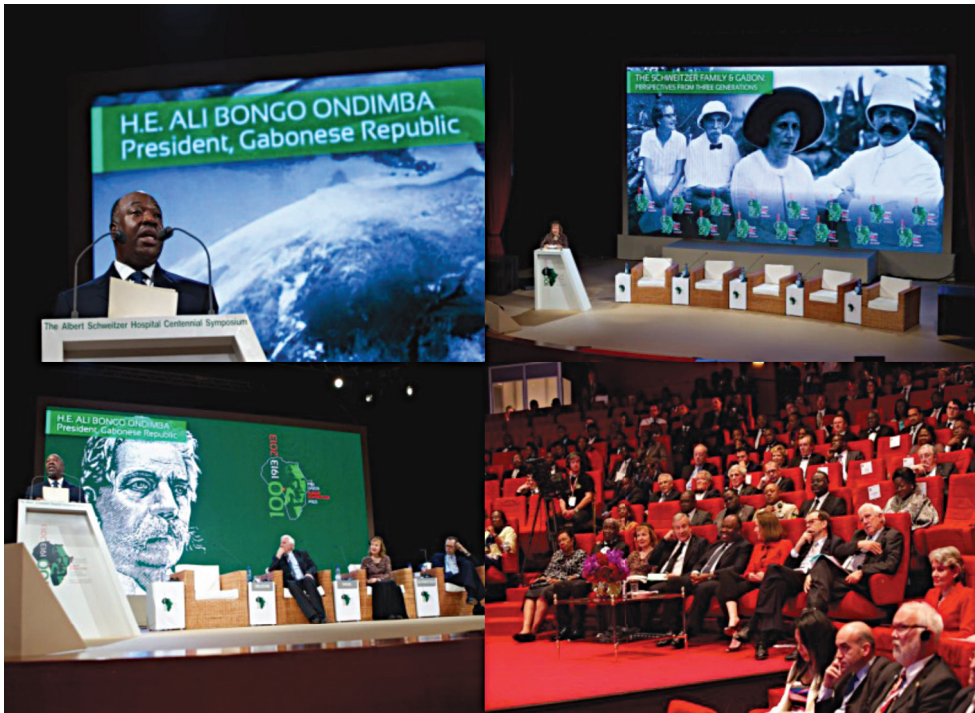
รูปที่ ๖ การประชุมฯ ในวันที่ ๖ กรกฎาคม พ.ศ. ๒๕๕๖ ณ ทำเนียบประธานาธิบดี กรุงลิเบรอวิลล์ ๑