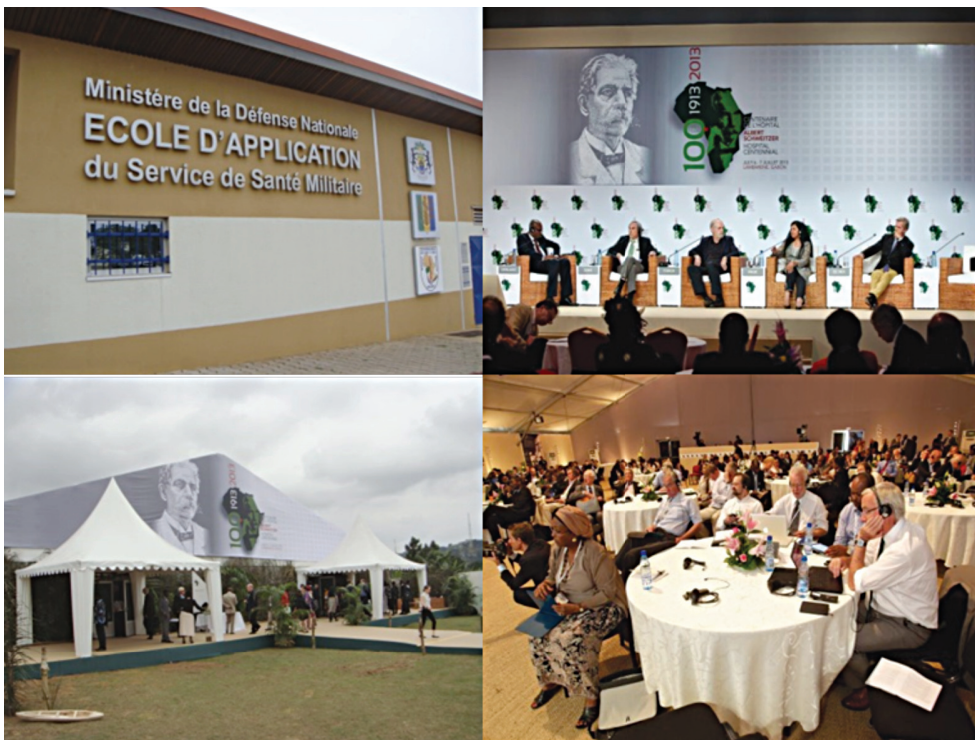
รูปที่ ๗ การประชุมฯ ในวันที่ ๗ กรกฎาคม พ.ศ. ๒๕๕๖ ณ โรงเรียนสอนการบริการสาธารณสุขทหารกรุงลิเบรอวิลล์ ๑