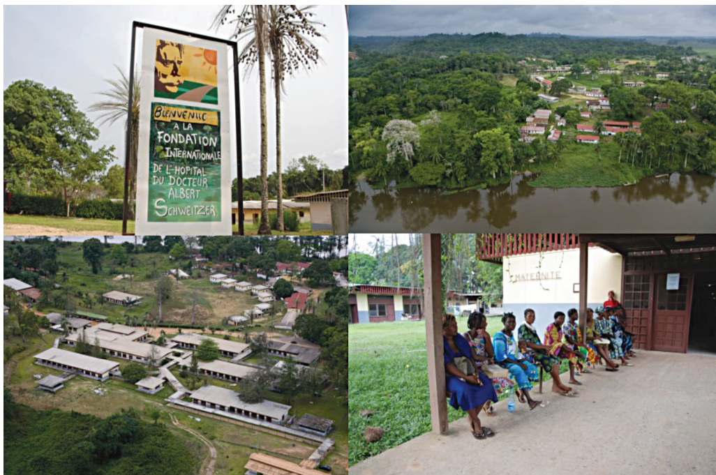
รูปที่ ๓ โรงพยาบาลอัลเบิร์ต ชไวท์เซอร์ ริมฝั่งแม่น้ำไอโกอูเว่ เมืองลอมบาเรเน่ ประเทศสาธารณรัฐกาบอง ๖