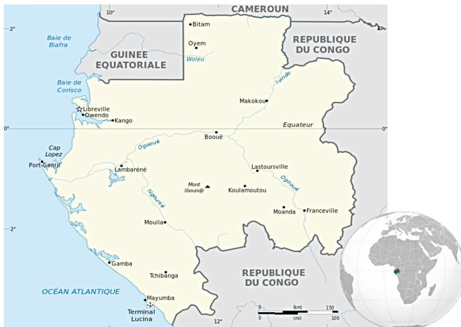
รูปที่ ๔ แผนที่ประเทศสาธารณรัฐกาบอง ในทวีปแอฟริกา แสดงที่ตั้งของกรุงลิเบรอวิลส์ เมืองหลวงของประเทศ และเมืองลอมบาเรเน่ ที่ตั้งโรงพยาบาลอัลเบิร์ต ชไวท์เซอร์ ๖