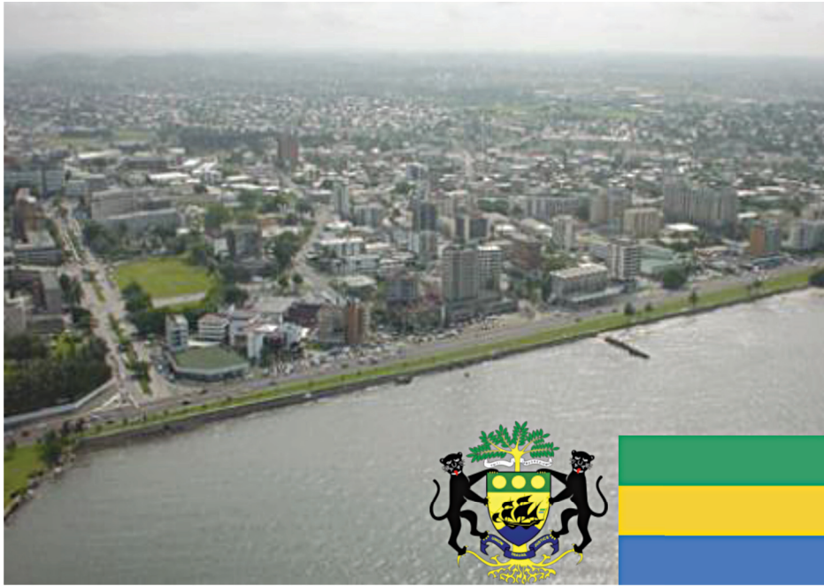
รูปที่ ๕ ภาพถ่ายทางอากาศของกรุงลิเบรอวิลล์ งามชาติ และตราสัญลักษณ์ของประเทศสาธารณรัฐกาบอง ๑๔

ประเทศสาธารณรัฐกาบอง อยู่ในทวีปแอฟริกา ตอนกลางด้านทิศตะวันตกติดกับมหาสมุทรแอตแลนติก มีพื้นที่ประมาณ ๒๗๐,๐๐๐ ตารางกิโลเมตร (ประเทศไทย ประมาณ ๕๑๓,๐๐๐ ตารางกิโลเมตร) ตั้งอยู่ในบริเวณ แนวเส้นศูนย์สูตร ทางด้านทิศเหนือมีอาณาเขตติดกับ ประเทศสาธารณรัฐอิเควทอเรียลกินี และสาธารณรัฐ แคนเมอรูน ทางด้านทิศตะวันออกและทิศใต้ติดกับ ประเทศสาธารณรัฐคองโก ประเทศกาบองได้รับเอกราช จากประเทศฝรั่งเศสเมื่อ ปี ค.ศ. ๑๙๖๐ ประชาชนของประเทศคนปัจจุบันคือ ๗ชนเผ่า อาลี บองโก ออนติмба ประธานาธิบดีแห่งสาธารณรัฐกาบอง มีกรุงลิเบรอวิลล์ เป็นเมืองหลวง